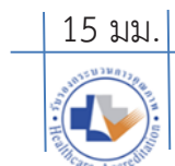
ขนาดเล็ก

การนำตราสัญลักษณ์เครื่องหมายการรับรองกระบวนการคุณภาพสถานพยาบาล ไปใช้ จะต้องจัดวางขนาดที่เหมาะสม และไม่ควรถ่ายสัญลักษณ์ที่มีขนาดเล็กกว่า 15 มิลลิเมตร โดยวัดจากความยาวฐานของตราสัญลักษณ์เป็นหลัก ยกเว้นในกรณีจำเป็น ซึ่งการใช้งานนั้นต้องสามารถแสดงรายละเอียดของสัญลักษณ์ได้ชัดเจน